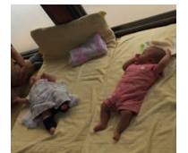
※ほのほの赤ちゃん コーナー(番外編)

●こねてのばして生地づくり ●ここが大事!真剣です ●ペアになってオーブン作り ●やった!上手く焼けたね!